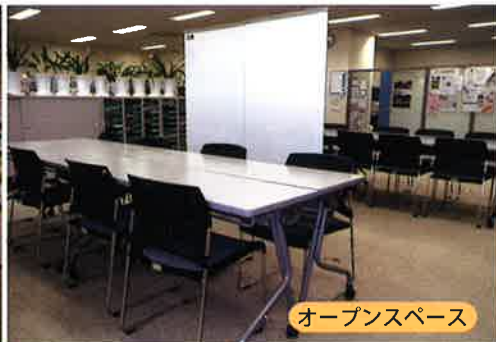
オープンスペース